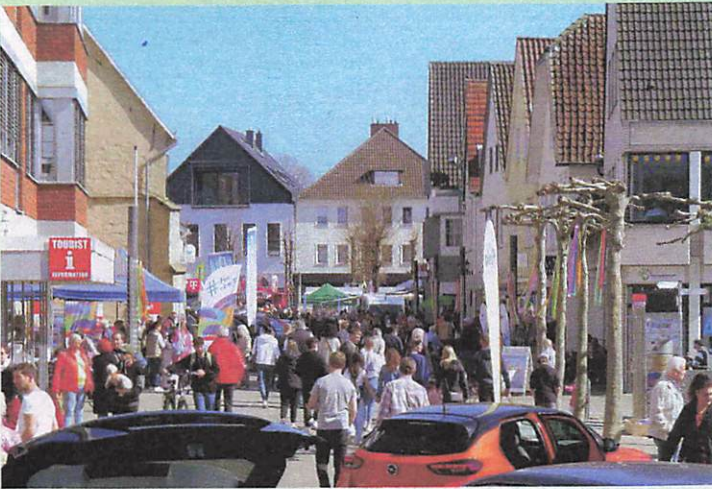
▲ »Rheda erblüht« lockt die Menschen in Scharen in die City.