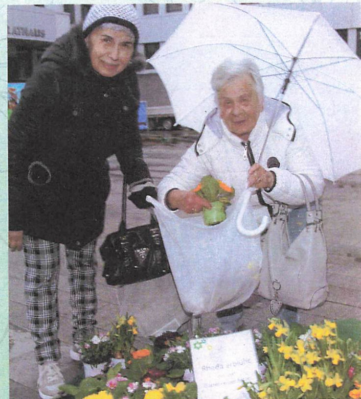
▲ Und sollte es regnen, »Rheda erblüht« ist einfach schön!

Ebenfalls für die musikalischen Frühlingsboten ist gesorgt. Es spielt das Fürstliche Trompeter Corps gesponsert wie in jedem Jahr von der Volksbank Bielefeld-Gütersloh. Zusätzlich spielt vor dem Rathaus der Spielmannszug Rheda in einer größeren Besetzung von 20 bis