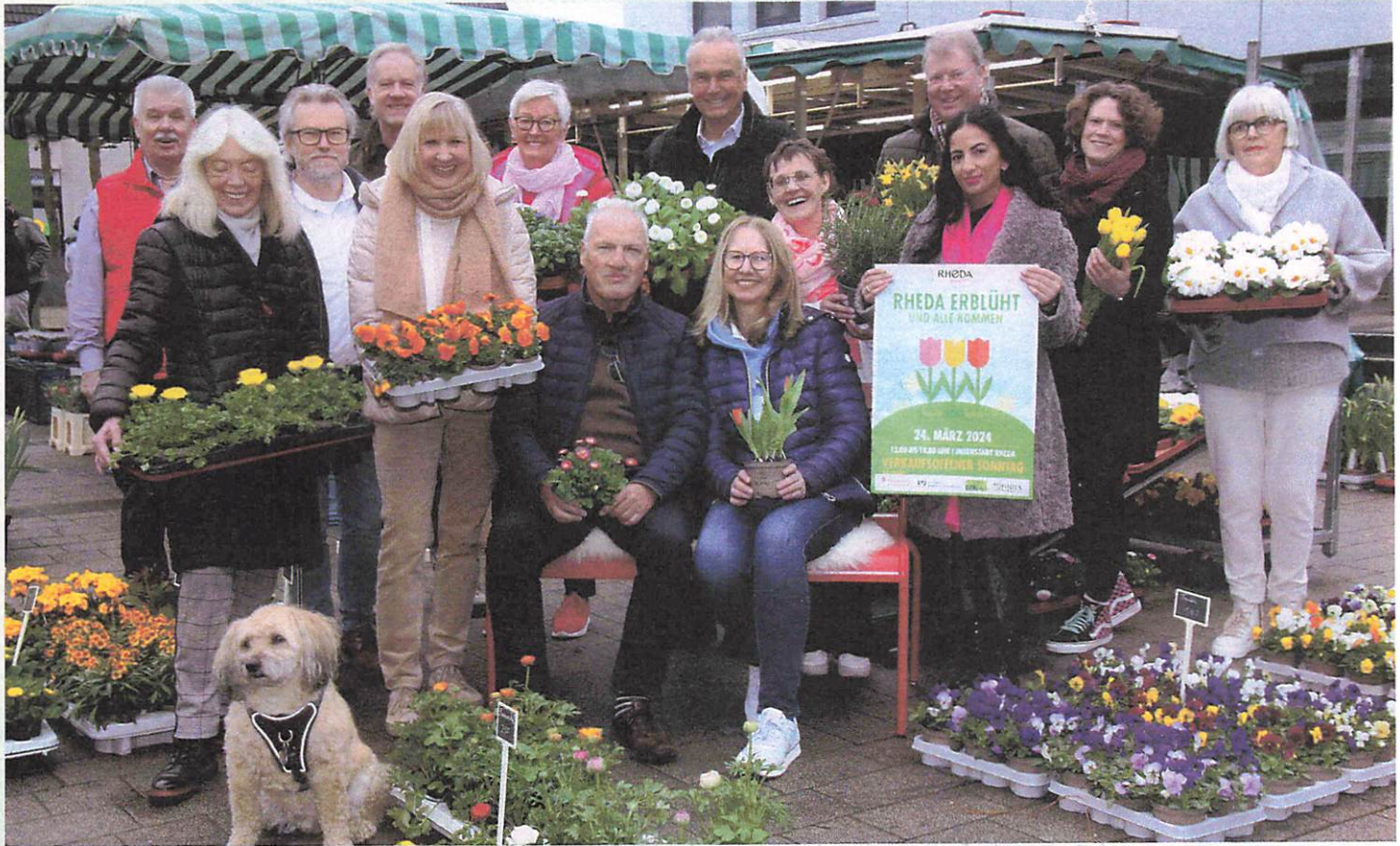
▲ Die Einzelhändler empfangen die Kundinnen und Kunden mit Frühlingsgrüßen.