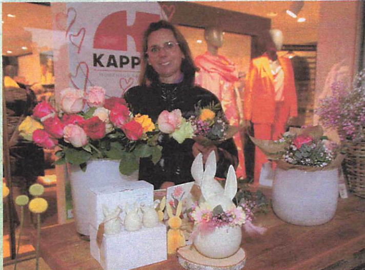
▲ Mode, Blumen und Einkaufslaune in Rheda erblühen beim Frühlingsfest.

Die Gewinner der Großen Verlosung können an der Losbude vor dem alten Amtsgericht die Preise